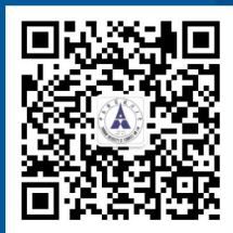
教务部微信公众号二维码